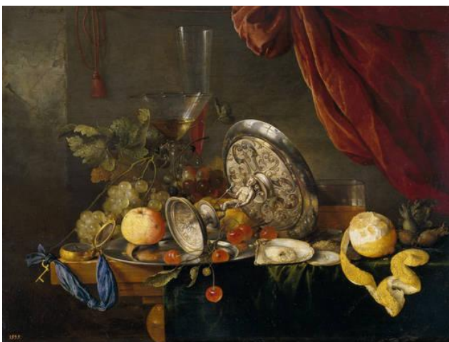
9.- Mesa . S XVII. Jan Davidsz. de Heem. Pintura barroca flamenca. Museo del Prado, Madrid.