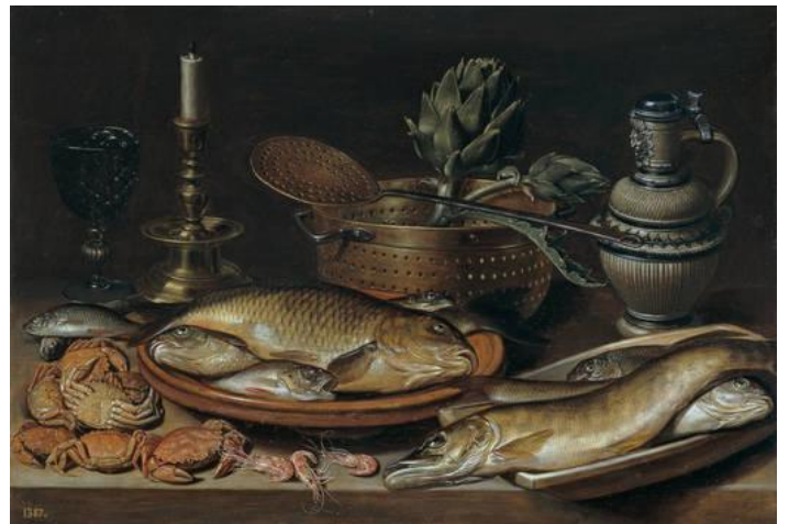
4.- Bodegón . 1611. Clara Peeters. Pintura barroca flamenca. Museo del Prado, Madrid.