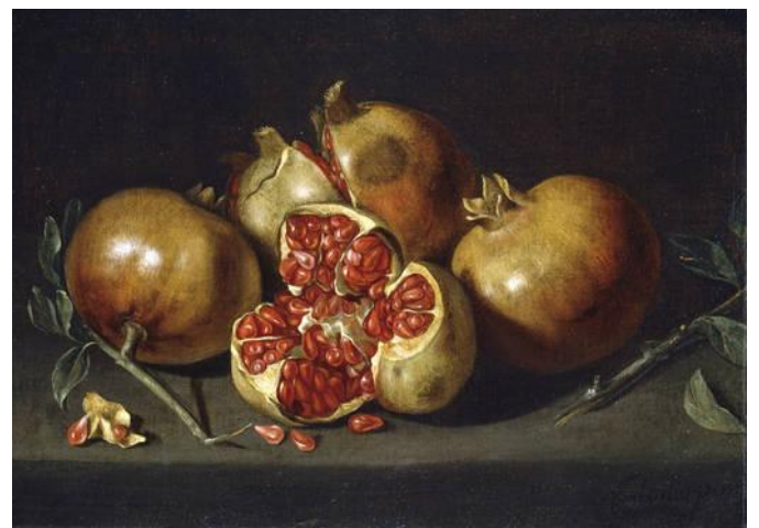
10.- Granadas . Segundo cuarto del s. XVII. Antonio Ponce. Pintura Barroca Española. Museo del Prado, Madrid.