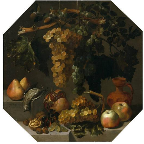
6.- Bodegón ochavado con uvas . 1646. Juan de Espinosa. Pintura barroca española. Museo del Prado, Madrid.