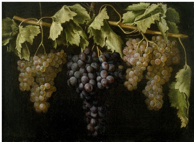
11.- Bodegón con cuatro racimos de uvas . Segundo tercio del s. XVII. Juan Fernández “El Labrador”. Pintura barroca española. Museo del Prado, Madrid.

Las tareas que se incluyen en el plan de trabajo a desarrollar, son las siguientes: