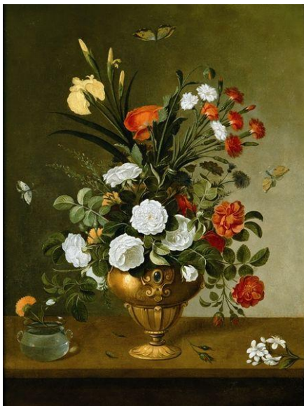
3.- Florero . 1663. Pedro de Camprobín. Pintura barroca española. Museo del Prado, Madrid.