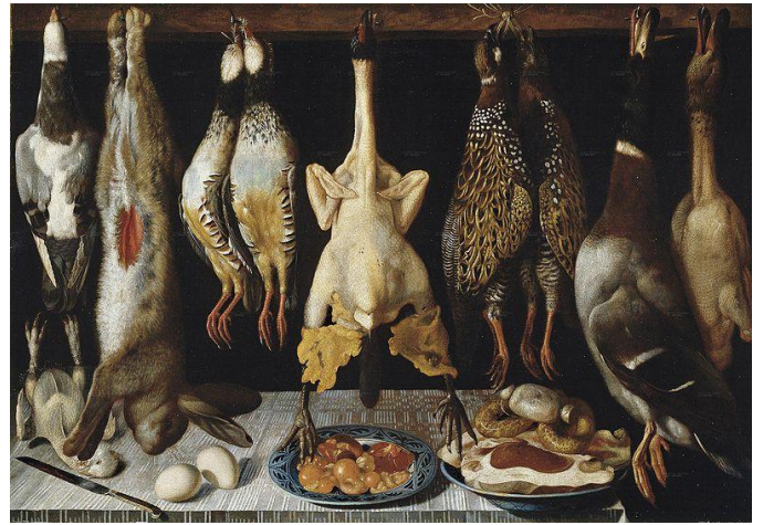
8.- Bodegón de aves y liebre . 1643. Tomás Hiepes. Pintura barroca española. Museo del Prado, Madrid.