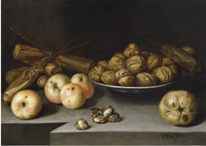
1.- Bodegón con manzanas, plato de nueces y caña de azúcar . 1645. Pedro de Medina Valbuena. Pintura barroca española. Museo del Prado, Madrid.

atención a la española (11, más de la mitad), para lo que se han seleccionado bodegones españoles que pertenecen a las colecciones del Museo del Prado (Madrid).