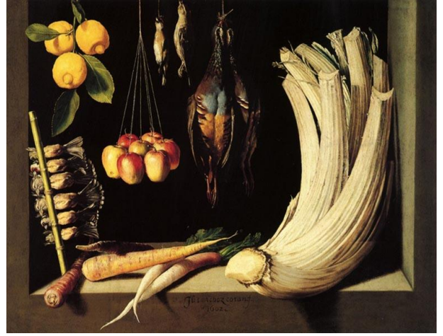
2.- Bodegón de caza, hortalizas y frutas . 1602. Juan Sánchez Cotán. Pintura barroca española. Museo del Prado, Madrid.