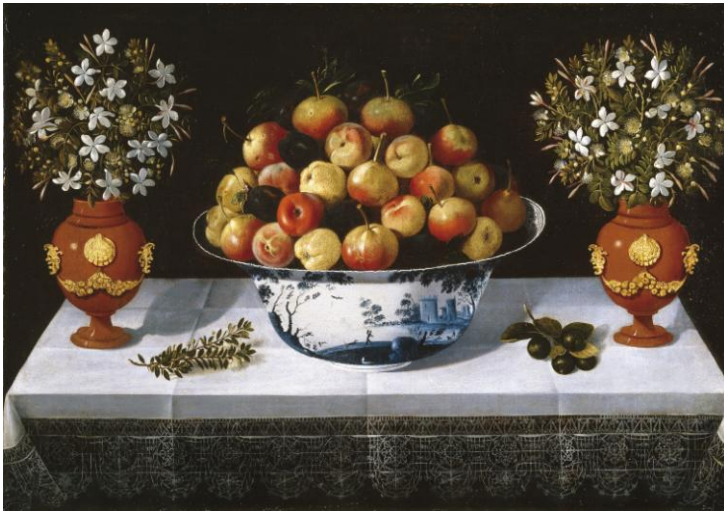
7.- Frutero de Delft y dos floreros . 1642. Tomás Hiepes. Pintura barroca española. Museo del Prado, Madrid.