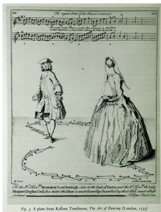
Fig. 3. A plate from Kellom Tomlinson, The Art of Dancing (London, 1735)

Ilustración 1. Ilustración de un antiguo tratado de danza. En el suelo aparece el trazado de los movimientos que realizarían los personajes al desplazarse por el espacio. Arriba, la partitura de la música que los acompañaría.